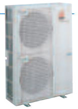
8 unités intérieures